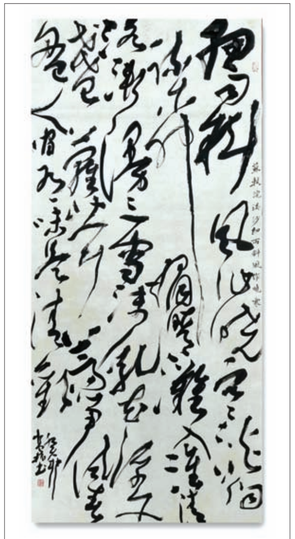
▲蘇軾《浣溪沙·細雨斜風作晚寒》